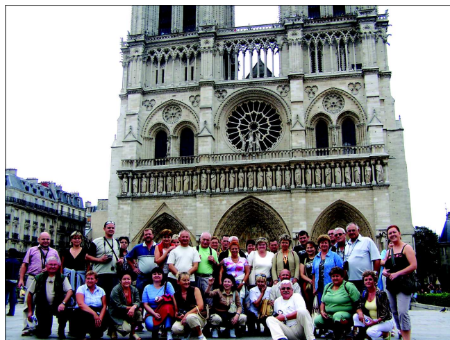
W Paryżu jest mnóstwo atrakcji, jedną z nich jest niewątpliwie wspaniała katedra Notre Dame.

Komisja Międzyzakładowa w dniach od 22 do 27 sierpnia 2007 r. zorganizowała wycieczkę turystyczną do Paryża dla członków Związku i ich rodzin.